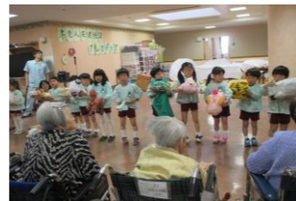
▲保育園児との交流会