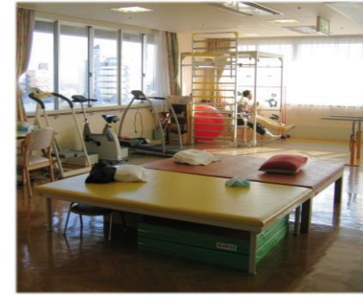
▲リハビリ室(5階) 専門の職員の指導のもと、それぞれの身体機能に合わせたリハビリメニューにより身体機能回復を図ります。