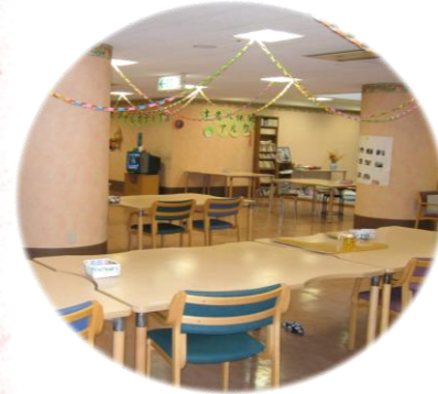
▲食堂・談話室(3・4階) お食事やレクリエーション、他の利用者様との会話をお楽しみいただけます。