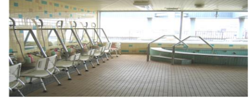
▲展望浴室(5階) 当施設目玉の一つ「展望浴室」。住み慣れた市内の大パノラマを一望しながら入浴いただけます。