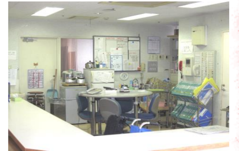
▲サービスステーション(3・4階) 看護・介護に関するご質問、ご要望はこちらのスタッフへお気軽にご相談ください。